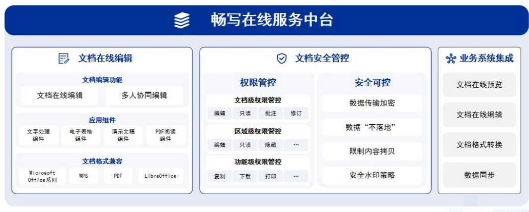
图 3-1 功能架构

畅写在线主要包括文档在线编辑、文档安全管控等功能模块，支持对接业务系统进行集成，模块功能如下：