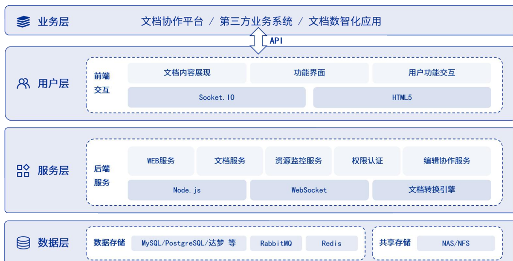
图 3-2 技术架构