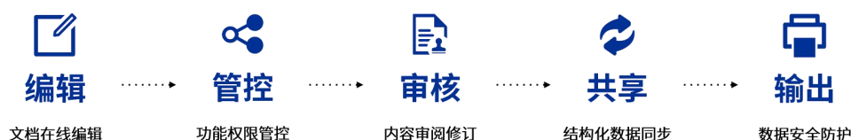
图 3-3 全流程编辑及协同

畅写在线提供全面的在线文档编辑及协同功能，包括文档在线编辑、功能权限管控、内容审阅修订、结构化数据同步、数据安全防护、文档格式转换，通过开放标准化接口方式为各类业务系统提供服务，助力业务系统实现在线文档协同的全流程管理，为企业提供安全易用的文档数字化解决方案。